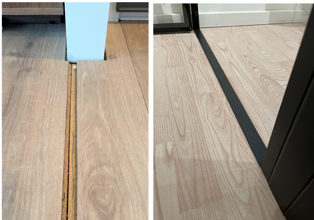
Billede: Bundskinne limes typisk fast til gulvet med alm. montagelim.

Såfremt løsningen inkludere en bundskinne, kan denne med fordel placeres således at gulvsamlinger/sprækker dækkes. Bundskinne limes fast med alm. montagelim.