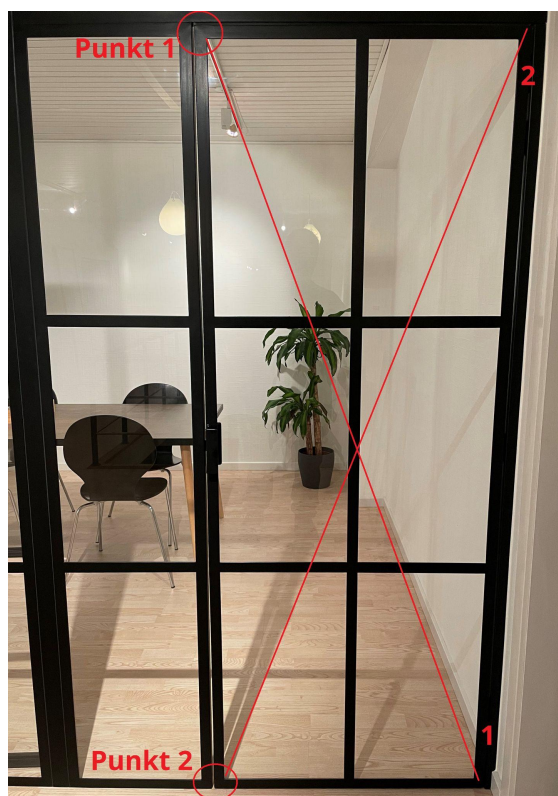
Figur 7.2: De røde cirkler indikere hvor der diagonalt skal justeres.

7.2 Såfremt dørens hjørner ikke er plan på forsiden i "punkt 1" eller "punkt 2" skal modsatte hjørne diagonalt flyttes frem eller tilbage.